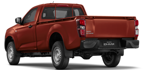
Namibu Orange Mica