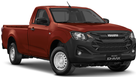
Namibu Orange Mica